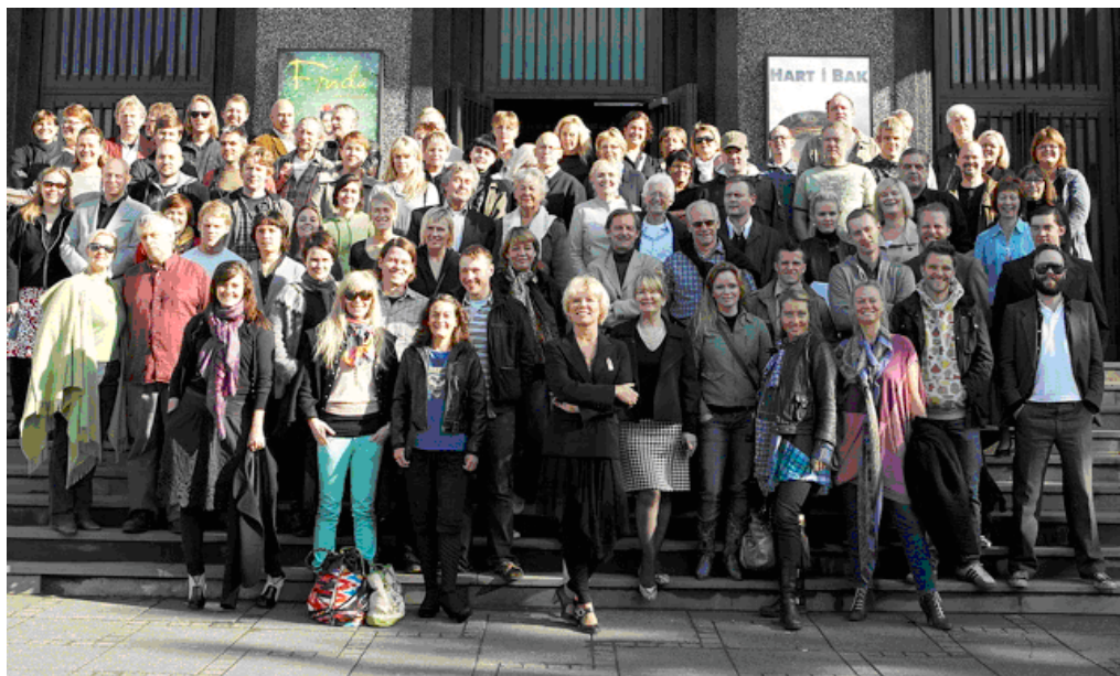
Leikarar og aðrir starfsmenn við setningu leikársins 2008 – 2009

Þessi stefnumótun var undirstrikuð með nýju einkennismerki í upphafi leikársins 2007/2008, þar sem hvert svið hafði sinn lit, auk þess sem farandsýningar fengu sinn lit. Lit hvers sviðs var síðan haldið til haga í frekari kynningu verka á viðkomandi sviði og farandsýningar kynntar með sínum einkennislit.